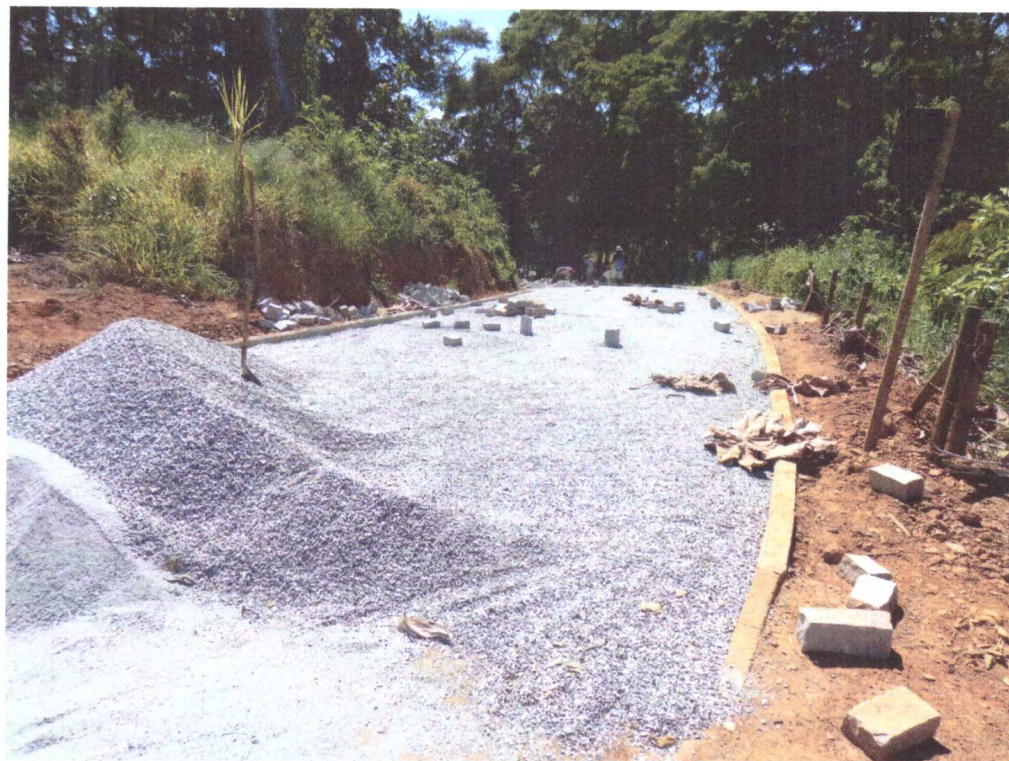
Bom Jardim, RJ, 09 de fevereiro de 2024.